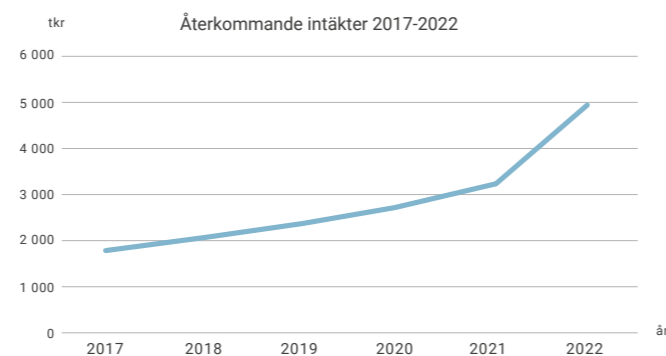
Tabell 2. Totala återkommande intäkter

De totala återkommande intäkterna, som inkluderar förbrukningsartiklar för Miris HMA™, serviceavtal etc., stod under 2022 för dryga 27% av den totala nettoomsättningen. Under 2021 var denna siffra 22%. Vi fortsätter med andra ord att öka delen av nettoomsättningen som kommer från de totala återkommande intäkter (Tabell 2). Detta är viktigt för en ökad stabilitet i våra prognoser och vår försäljning och visar samtidigt hur användningen av Miris HMA™ ökar.